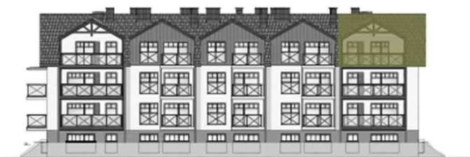
⊙ ELEVACJA PÓŁNOCNO -WSCHODNIA