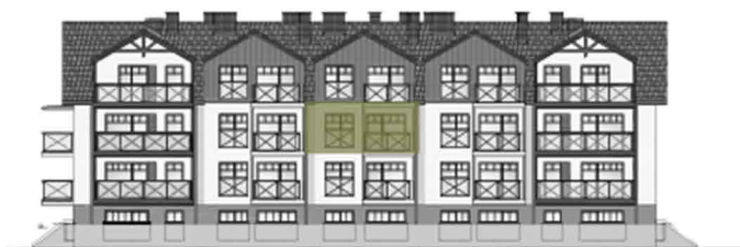
⊙ ELEVACJA PÓŁNOCNO -WSCHODNIA